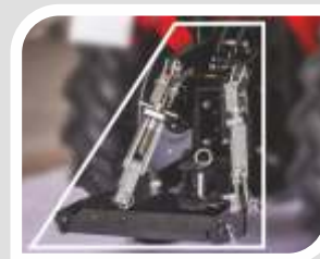
Robustes 3- Punkt-Gestänge