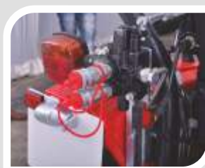
Umwandelbares einfach- /doppeltwirkendes Steuerventil